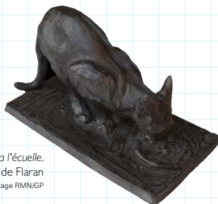
Rembrandt Bugatti, Chat à l'écuelle . Galerie tactile Petit Zoo de Flaran

Durée : entre 1h et 1h30. Nombre maximum d'élèves : 15. Chacun repart avec sa sculpture. Prévoir des cartons ou cagettes pour rapporter les travaux.