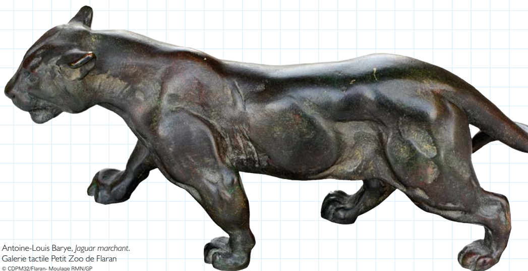
Antoine-Louis Barye, Jaguar marchant.

Galerie tactile Petit Zoo de Flaran