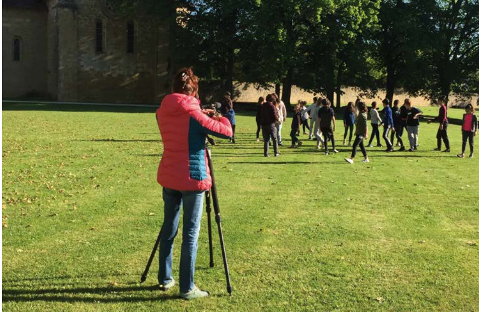
Tournage d'un film Espace visible et invisible sur l'accessibilité du patrimoine pour tous avec les élèves du collège de Condom (2019)