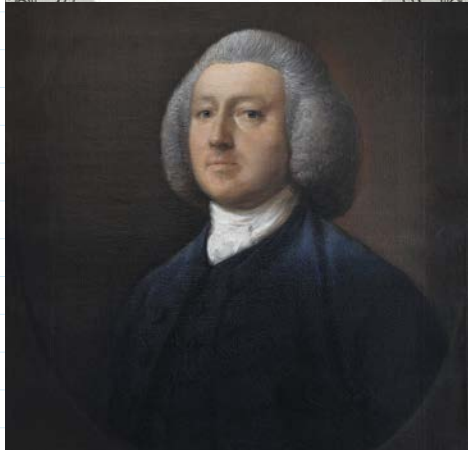
T. Gainsborough, Portrait du Dr. W. Walcot (1767)