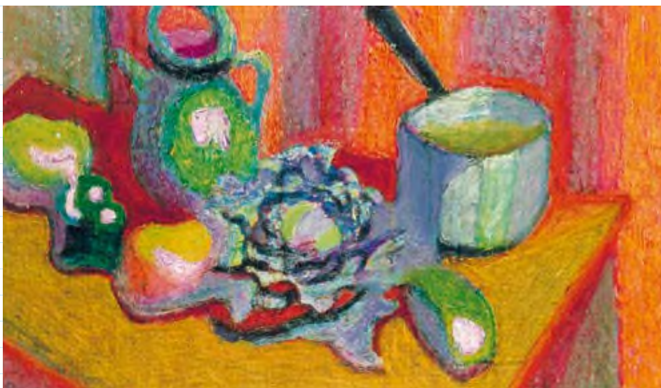
Z. Ruszkowski, Nature morte