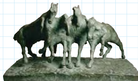
Z. Ruszkowski, Chevaux de cirque

Découvrez autrement l'art de la sculpture grâce à l'exposition tactile Le petit zoo de Flaran : permis de toucher! qui présente des moulages de sculptures animalières issues des grands musées français (moulages réalisés par la RMN-GP).