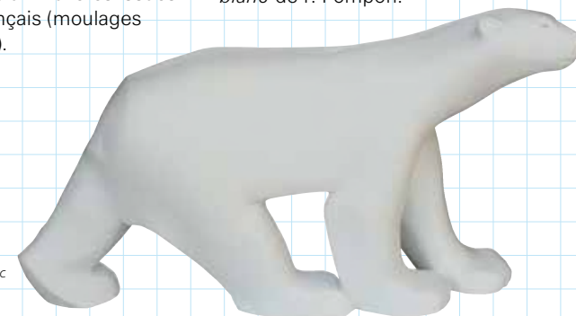
F. Pompon, Grand ours blanc

Après une étude de l'œuvre, est proposée aux élèves la réalisation de leur propre œuvre « à la manière de... ». Autour du Grand ours blanc de F. Pompon.